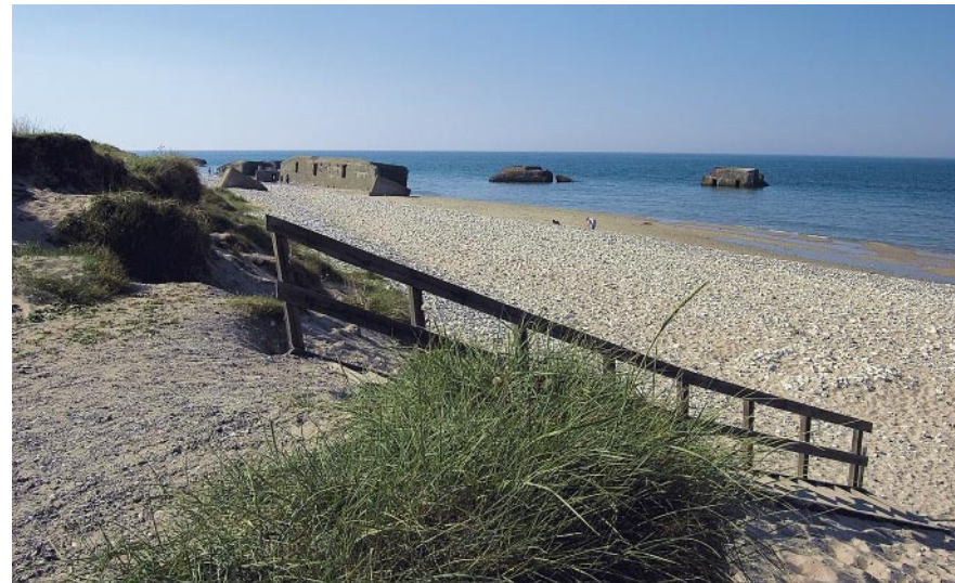
Am Strand von Vigsø versinken die Bunker im Wasser.

Auf Höhe des Waldes führt unser Pfad durch niedrige Dünen und wir verlieren kurzzeitig die Sicht auf die Nordsee. An einem Gatter treffen wir neben einer Informationstafel senkrecht auf den Waldrand. Hier verlassen wir den geradeaus weiterführenden, gelb markierten Kammweg und biegen nach rechts ab, ebenfalls gelb markiert. An einer Baumreihe entlang führt uns der breite Wiesenweg in einem großen Linksbogen vorbei an drei Grabhügeln und an den ersten Ferienhäusern von Vigsø . Hinter den Ferienhäusern gehen wir auf einer Wiese schräg links bergab, bis zu einer Straße, mit der wir nach links den Købmand von Vigsø erreichen.