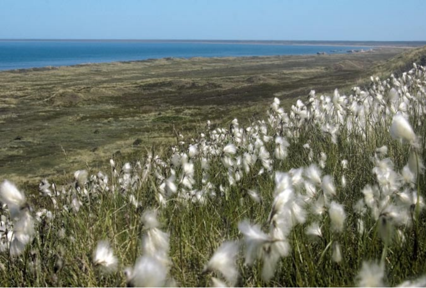
Wollgras am Steilhang oberhalb der Vigsø Bugt.

gen der Markierung nach rechts. Ein kleiner Waldpfad führt uns in einem Linksbogen bergab. An einer Bank halten wir uns rechts, an der Kante des Steilhanges bei einer weiteren Bank dann links, schräg bergab. Wir queren einen Wiesenhang in Richtung Vigsø auf halber Höhe. Bald kommen wir an eine Wiesenwegkreuzung mit einem Holzpflock mit gelbem Punkt und gehen rechts hinunter zur Straße. Diese überqueren wir und gehen rechts an einigen neuen Häusern vorbei Richtung Meer. Unmittelbar hinter den Häusern stoßen wir auf eine Straße, die uns zu einem Parkplatz am Nordsee-Strand bringt. Dort zweigt ein Schotterweg mit dem gelben Dreieck und dem stilisierten Schiffsrumpf des Vestkyststien , des »Westküstenweges«, links von der Straße ab und bringt uns zu einem weiteren Parkplatz. Von dort folgen wir weiter den roten Holzpflocken mit dem Vestkyststien-Zeichen durch die Heide- bzw. Dünenlandschaft zwischen dem Steilhang zu unserer Linken und dem Strand.