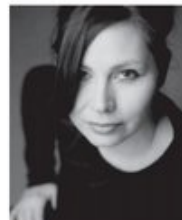
Designerin: Pernille Veja

Viele der bekanntesten und beliebtesten Produkte aus Menu's Sortiment stammen von Pernille Veja. Pernille – und nicht zuletzt ihre Entwürfe – sind im Laufe der Zeit mit zahllosen Designpreisen und Ehrungen ausgezeichnet worden.